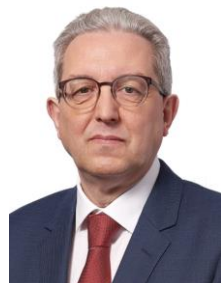
Servicios Financieros, Económicos y Generales Salvador Bonacasa